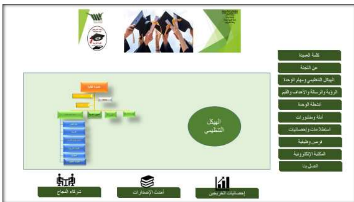
الشكل (٣) نموذج لموقع الوحدة على موقع وحدة الخريجين بالجامعة