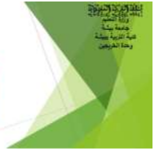
الشكل (١) شعار الوحدة